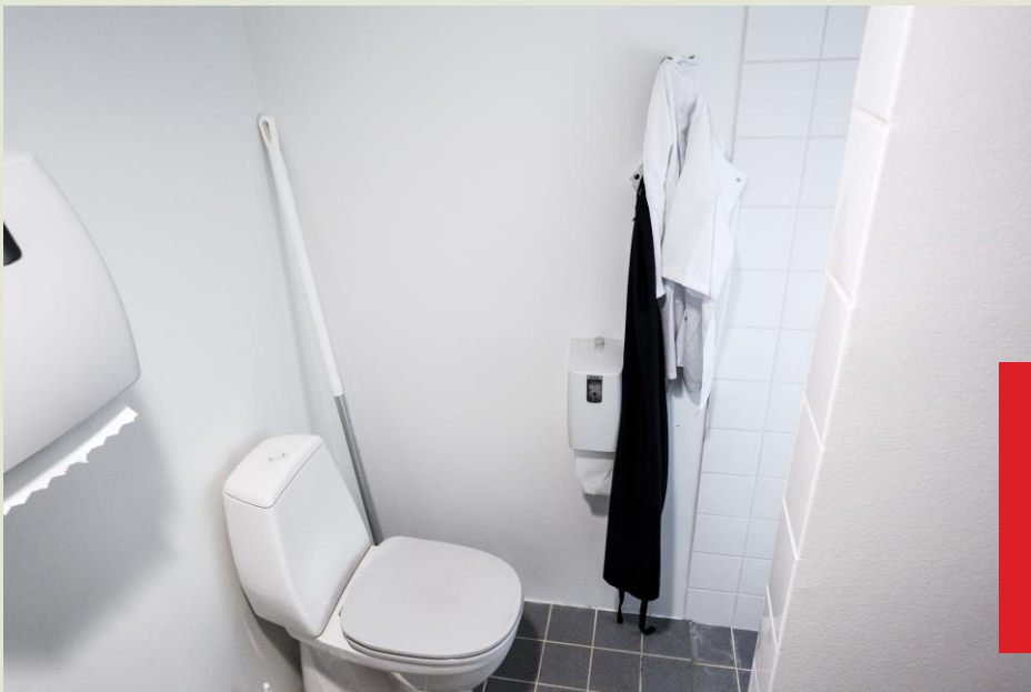
Arbejdstøj hænger på toilettet