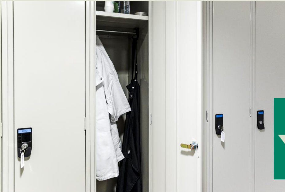
Arbejdstøj hænger i garderobeskab